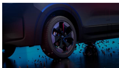
La nueva llanta de serie "Indianápolis" del PanAmericana es la primera llanta de aleación de 19 pulgadas en la historia de la línea de productos Transporter

Volkswagen Vehículos Comerciales presenta los primeros detalles específicos de la séptima generación de su Transporter 1 , al tiempo que desvela una versión especialmente carismática y versátil: el PanAmericana 1 . "Desde el principio y a lo largo de todas las generaciones, el Transporter ha sido un vehículo robusto y práctico. Y lo consigue en su forma más bella. Por eso se ha convertido en un icono. Ahora, con nuestro séptimo Transporter, hemos conseguido crear otro vehículo que cumple precisamente estos criterios: un vehículo robusto con un diseño muy atractivo. Sigue a la perfección el ADN del Bulli clásico, pero hemos mejorado sistemáticamente el diseño, como demuestra a la perfección el nuevo PanAmericana", afirma Albert Kirzinger, responsable de Diseño de Volkswagen Vehículos Comerciales. Kirzinger añade: "Incluso el primer PanAmericana, basado en el T5, transmitía la impresión de que nada se le podía acercar. Este encanto y sensación de frescura también se refleja en cada detalle del nuevo PanAmericana".